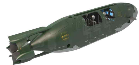
카비 카따네오사의 SDV 딥 새도우