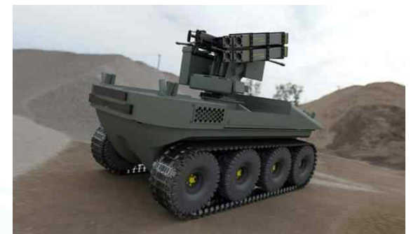
히포 전지형 지원차량(ATSV)