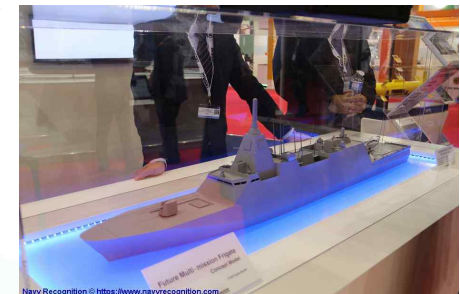
전시된 신형 다중임무 호위함의 모델