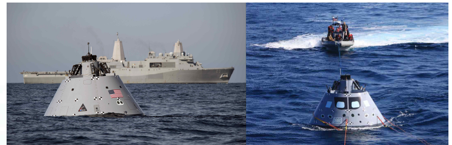
상륙수송함과 BTA를 이용해 URT를 실시하고 있는 미 해군과 NASA