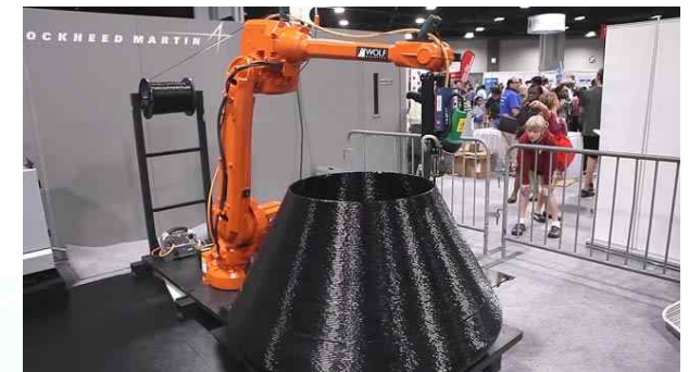
3D 프린팅 로봇 암(Arm)