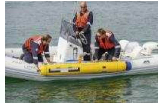
GD사의 UUV '블루핀-9'