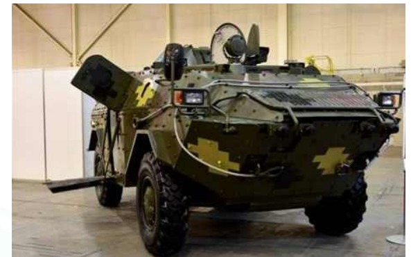
신형 BRDM 몽구스 전투정찰차