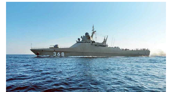
북해에서 시운전 수행중인 바실리 비코프함