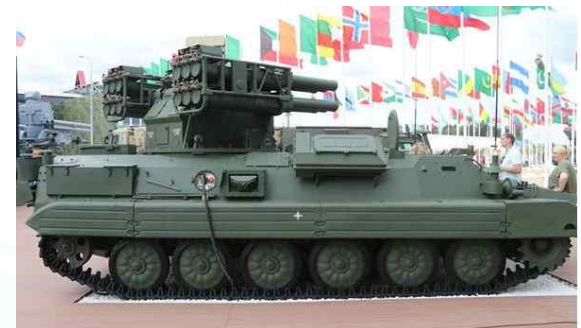
소스나 방공미사일체계(Army-2018 국제군사기술 포럼)