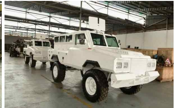
우간다의 장갑차 생산시설(좌)과 은요카 장갑차