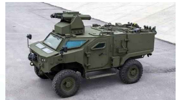
파르스 4x4 ATV