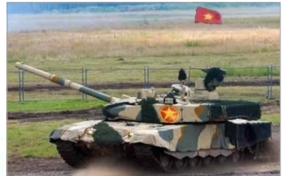
베트남 T-90 전차