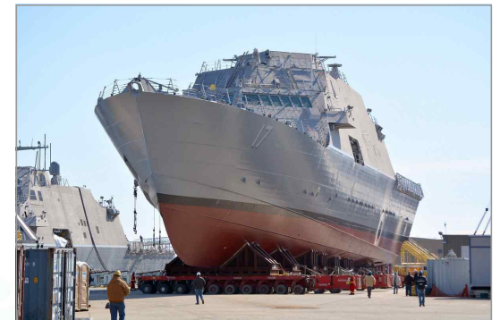
최근 진수한 LCS-17(인디애나 폴리스함)