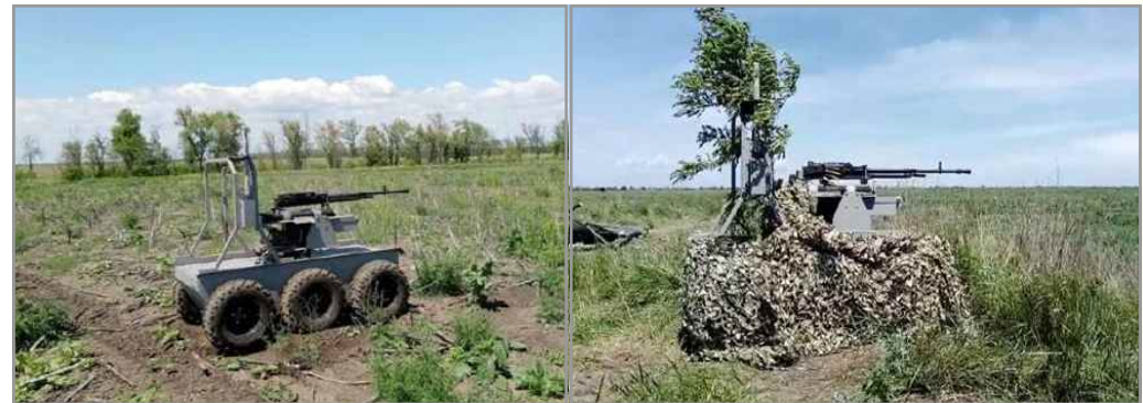
무장 형상 RSVK-M2 UGV

○ 이격 거리 1.5km에서 제어할 수 있으며, 항(抗)재밍 통신능력 구비