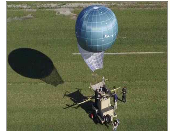
WASP 계류식 기구