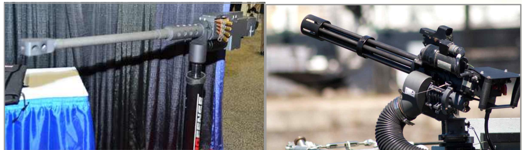
Cal .50 PF 50 화포

• 프로펜스사는 유사한 개틀링포를 인도네시아, 터키 및 기타 국가에 공급 실적 보유