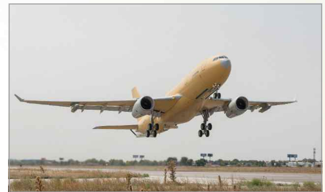
이륙 중인 A330 MRTT Phénix

[출처] First Phénix tanker rises for France, flightglobal.com, 2017. 9. 8.