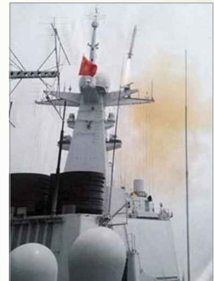
구축함에서 발사되는 YJ-18 대함미사일