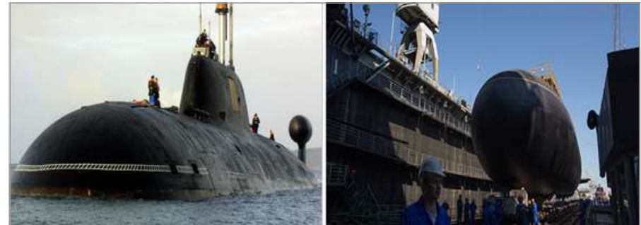
아쿨라-Ⅱ급 핵추진 공격잠수함(좌)과 바르스반키급 디젤-전기추진 잠수함