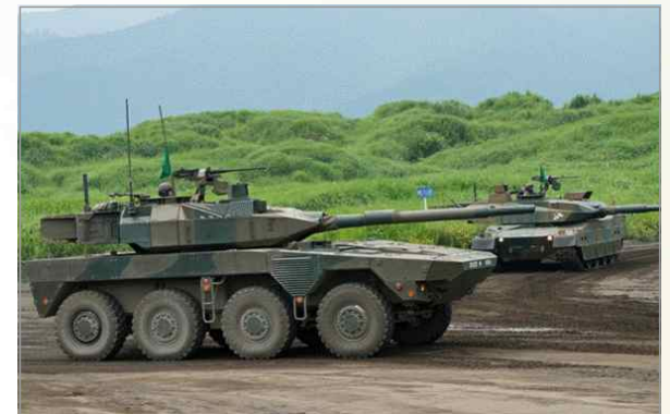
8×8 구축전차 16식 MCV

- 남서해역 도서지역에 적이 침입하면 MCV 배치된 신속전개연대가 C-2 수송기로 우선 전개