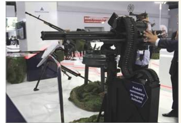
WLKM 12.7mm 4개 총열 기관총