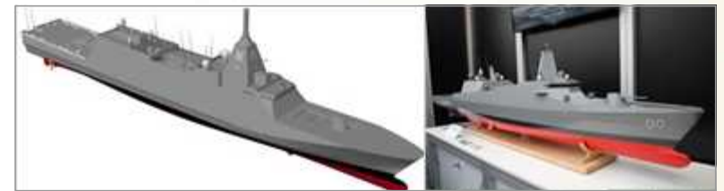
30DX의 컴퓨터 이미지(왼쪽)와 미쓰비시중공업의 30FF 모형