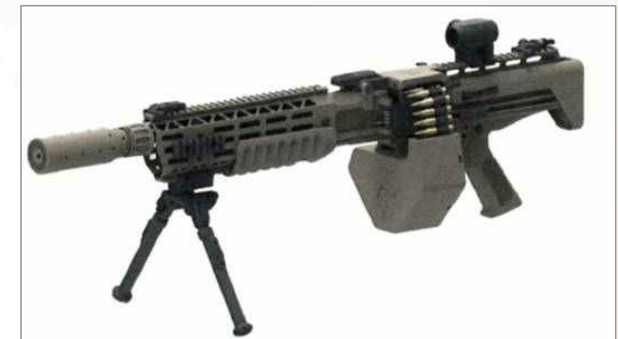
스톨너 엑스트라 경기관총(X-LMG)