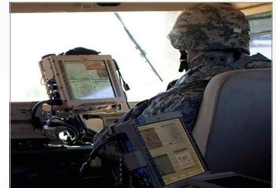
MFoCS 차세대 전투 컴퓨터 체계