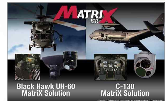
MatriX ISR 체계 솔루션

[출처] L3 WESCAM Launches MatriX ISR System Solutions Kits for Fixed- and Rotary-Wing Airborne Platforms, asdnews.com, 2017. 5. 16.