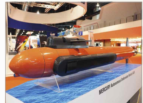
IMDEX 2017에 전시된 머큐리 AUV