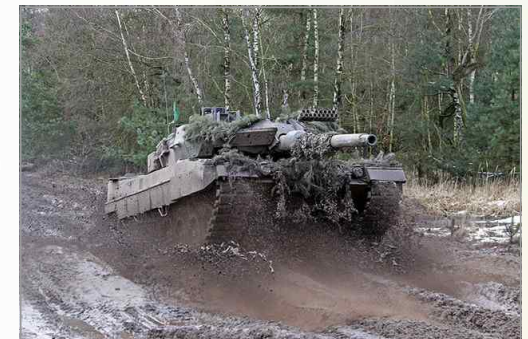
독일 육군 주력전차 레오파르트 2