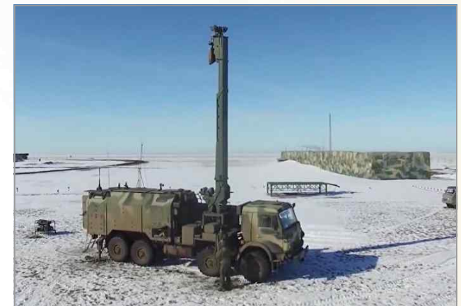
음향-열상 정찰체계인 페니실린

[출처] 1. Russia to launch production of counter-artillery radar "penicillin" in 2019, armyrecognition.com, 2017. 5. 12. 2. Russia's 'Penicillin' anti-artillery system suppresses fire in five seconds flat, sputniknews.com, 2017. 5. 14.