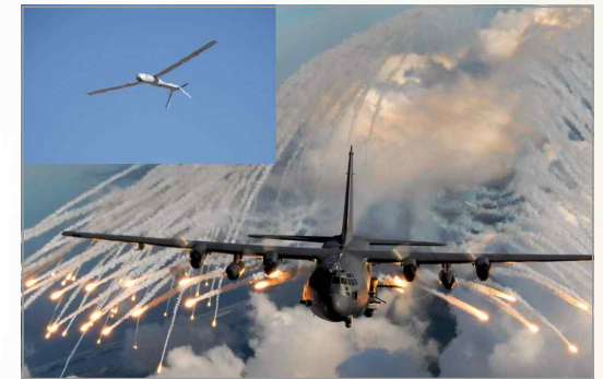
AC-130J 공격기와 알티우스 무인기(좌상)