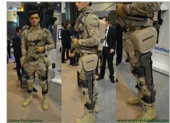
IDEF 2017에서 공개된 아셀산사 외골격체계 '아시아'