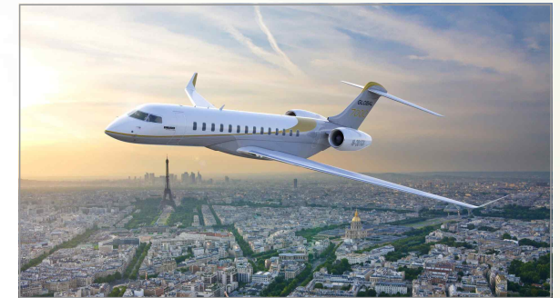
Global 7000 여객기

[출처] Global 7000 hits M0.995 in high-speed tests, flightglobal.com, 2017. 3. 29.