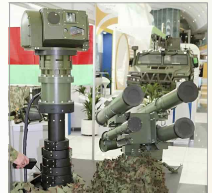
신형 쉐르셴-M 대전차유도미사일

• 벨라루스 방산업계가 해외로 시장을 확대하려는 노력의 결과이며, 쉐르셴-M 체계는 개방형 아키텍처를 채택하고 있어 비슷한 형태의 레이저 빔 유도방식 ATGM 탑재 가능