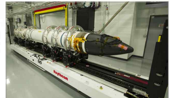
레이시온사 SM-3 미사일

- 2004년부터 배치된 SM-3 I A/B의 2단 및 3단 부스터 직경이 13.5인치인데 비해, SM-3 IIA는 21인치이므로 비행시간이 길고 더 높은 외기권에서 표적과 교전 가능