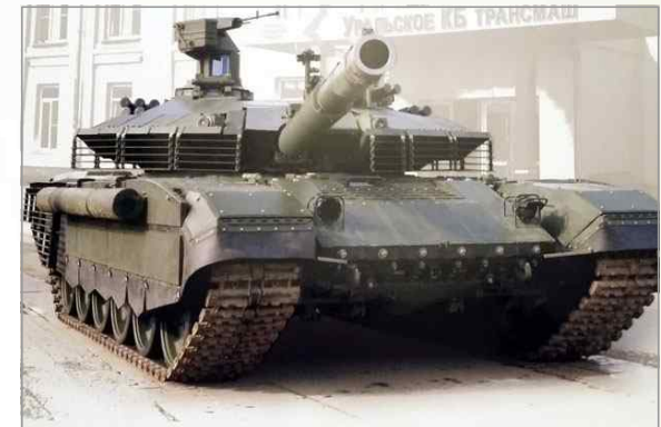
러시아 T-90 전차 최신 버전