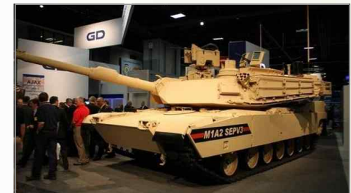
주력전차 M1A2 에이브람스 SEP V3

출처 1. U.S. Army will begin the development of M1A2 Abrams SEP V4 main battle tank, armyrecognition.com, 2017. 2. 13. 2. The Army's More Lethal M1A2 SEP v4 Abrams tank Will Start Testing in the 2020s. scout.com, 2017. 2. 8.