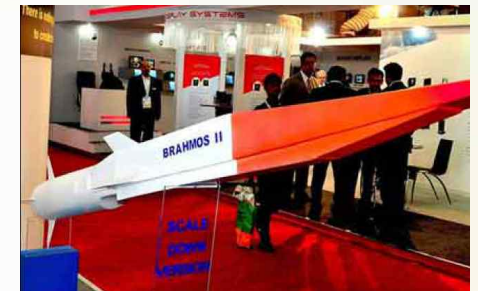
브라모스 초음속 순항미사일