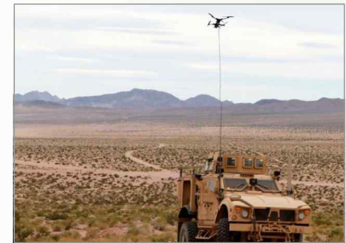
차량에 적재하여 운용 중인 NM& TS150