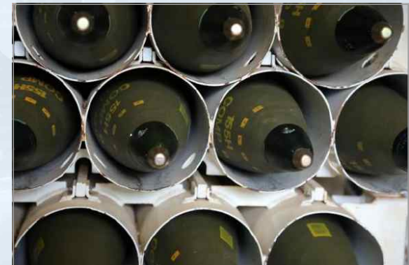
팔라딘 M109A6 자주포에 적재된 155mm 야포탄