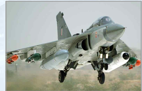
무장을 장착하고 이륙중인 테자스 전투기