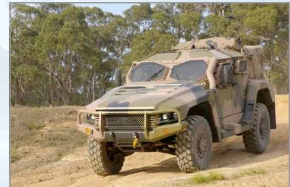
신형 4×4 경(輕) 고기동방호차량 호케이