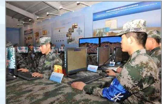
중국 사이버작전 전담 특수부대