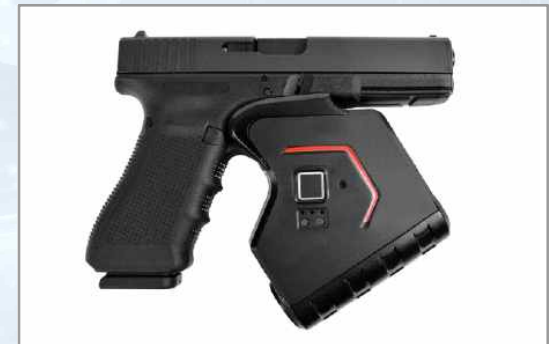
‘아이덴티 록’을 방아쇠에 설치한 권총