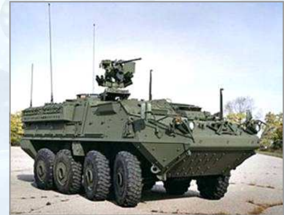
8×8 병력수송장갑차 스트라이커

| 출처 | General Dynamics to design cannon for US Army's Stryker vehicles, army-technology.com, 2016. 1. 18.