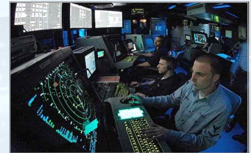
미 공군 C4ISR체계 운용