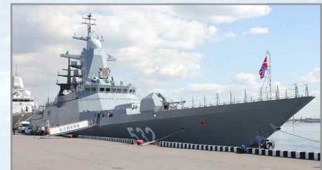
러시아 해군의 프로젝트 20380급 초계함