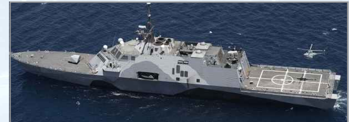
미 해군의 프리덤급 연안전투함