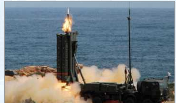
SAMP/T 방공체계에서 아스터 30 미사일 발사

| 출처 | France launches upgrade of Aster 30 missile's BMD capabilities, janes.ihs.com, 2016. 1. 15.