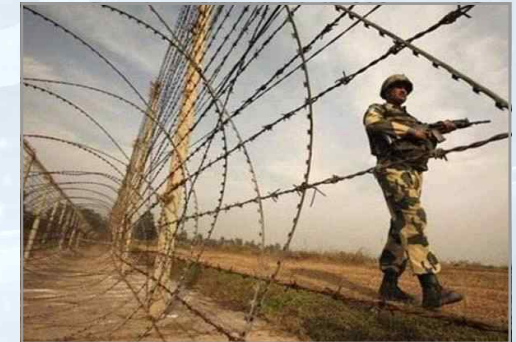
인도-파키스탄 국경 방호