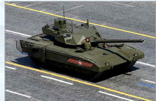
주력전차 T-14 아르마타