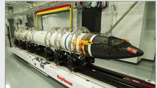
SM-3 블록 IIA 요격미사일