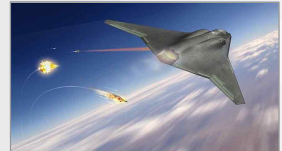
노스롭그루먼사의 6세대 전투기 개념도