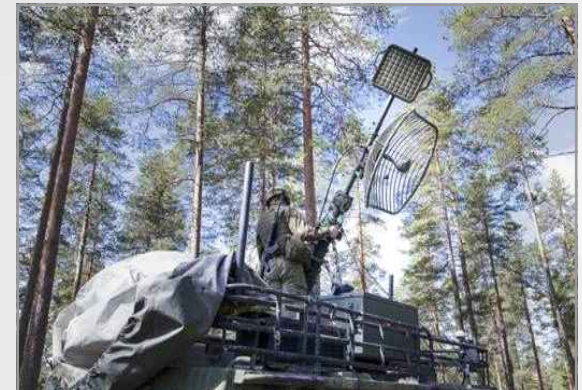
비티움사의 전술무선 IP 네트워크(TAC WIN)