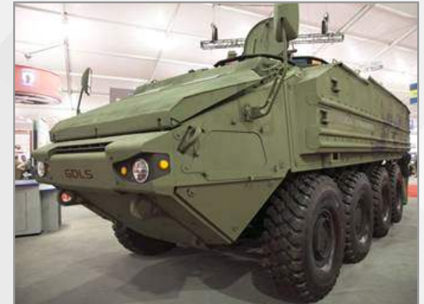
제너럴다이내믹스사 ACV 시제차량