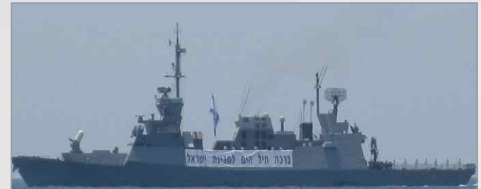
로켓방어 능력을 탑재한 이스라엘의 Saarr 5급 초계함 라하브함

※ DRDO : Defense Research and Development Organization