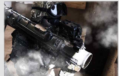
SAAB M4 포의 견착 사격