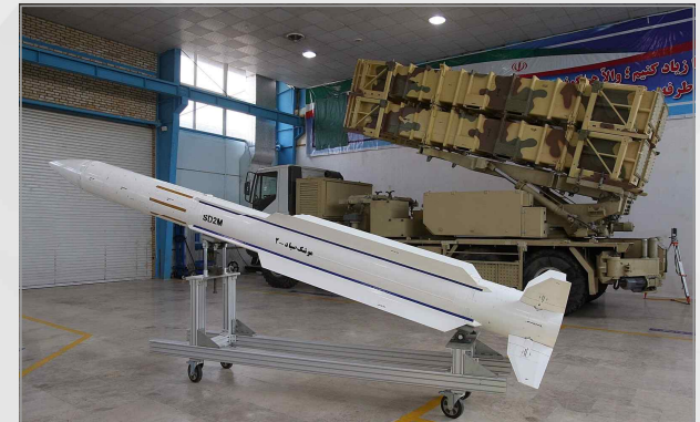
이란의 사이야드 방공미사일