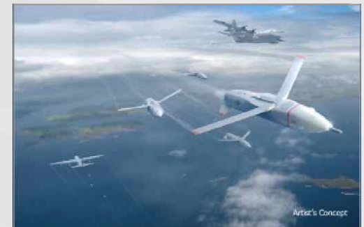
Gremlins 시스템의 운용 개념도