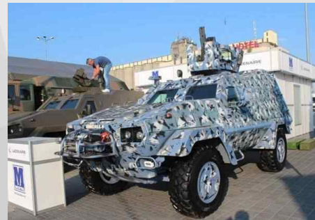
라스네루사 신형 온실라 장갑차