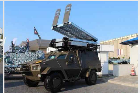
공격작전용 사다리를 장착한 온실라