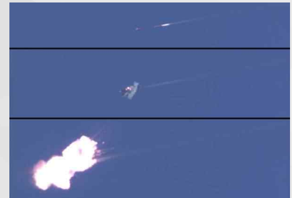
무인기를 타격하는 바락 8 미사일(2014년 11월)