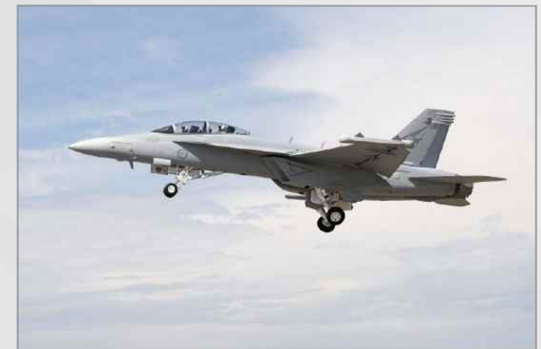
호주공군용 EA-18G의 첫 비행시험