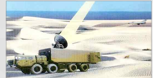
비행체의 전자 장비를 무력화하는 Microwave 포