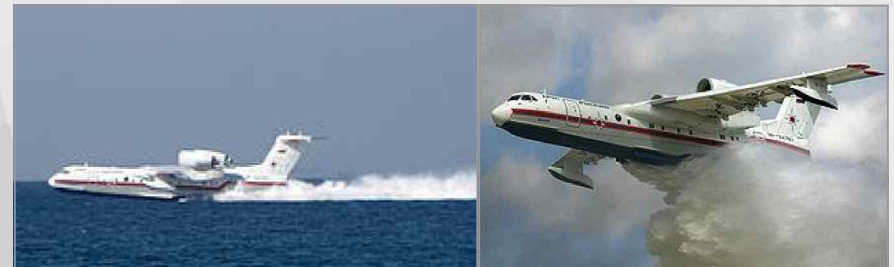
바다에서 소화수를 적재하는 Be-200