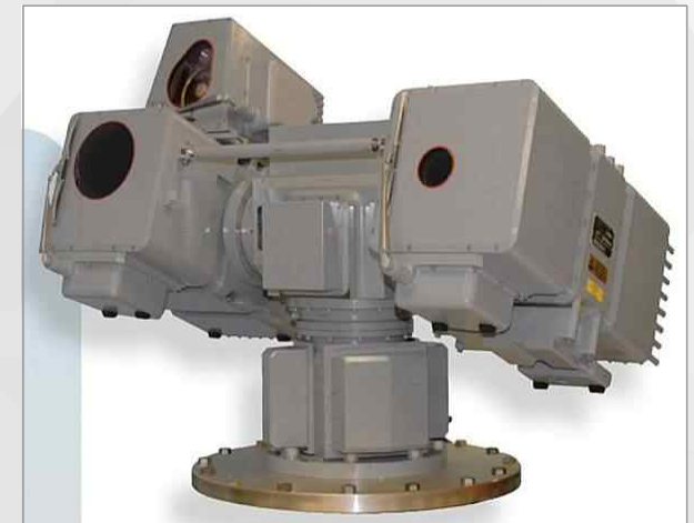
MK 20 전자광학 센서체계(EOSS)