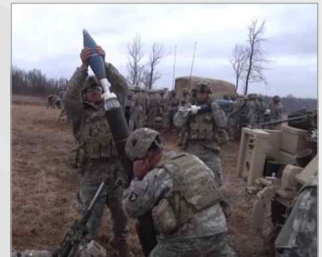
M395 APMI GPS 유도 박격포탄 사격