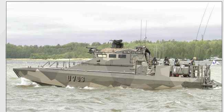
핀란드의 고속상륙정 Jehu