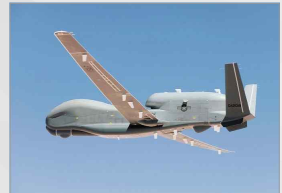
MIAA ABSAA 시스템이 장착될 RQ-4B