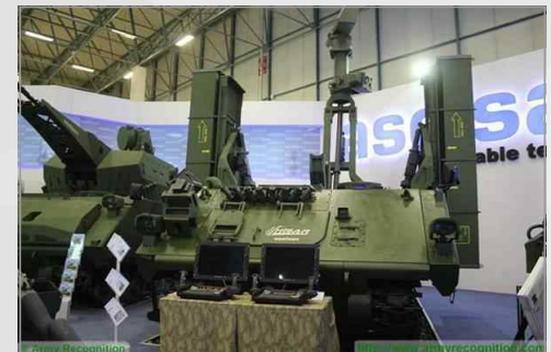
터키의 Hisar-A 저고도 방공미사일체계