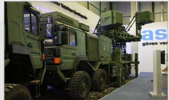
KORAL 레이더 EA 체계