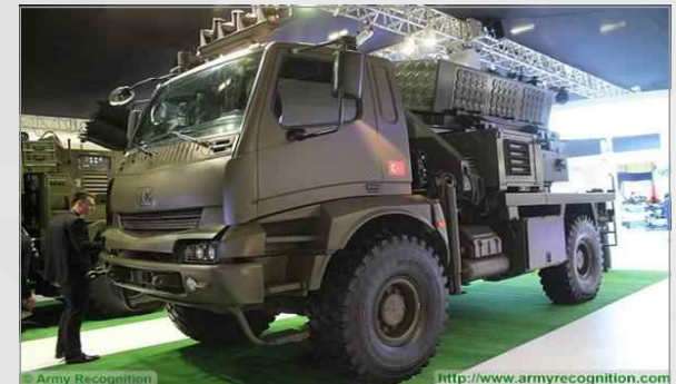
방산전시회에 전시된 T-107/122 MBRL