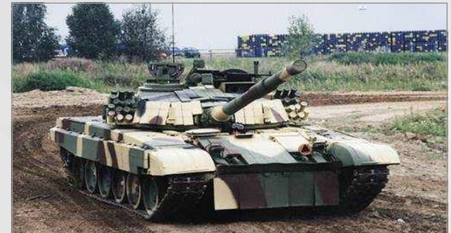
폴란드 PT- 91 주력전차