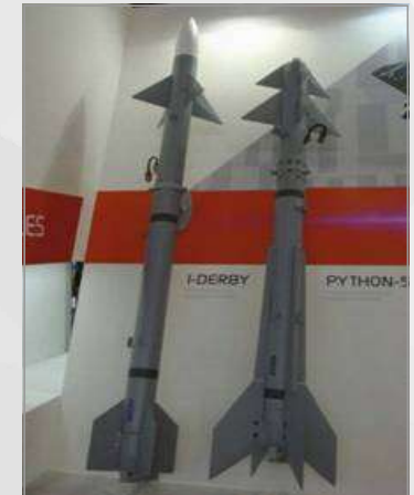
i-더비(좌) 및 파이톤-5(우)

• 라파엘사가 신형 RF 탐색기를 자체 개발함으로써 외부 지원에 의존하지 않고도 미사일 완제품을 제작할 수 있게 되었다는 데 큰 의의가 있음.