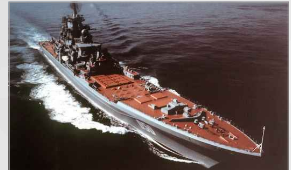
러시아의 키로프급 순양함