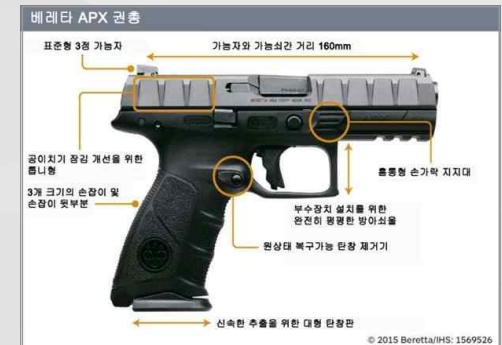
베레타사의 신형 APX 권총