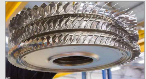
3D 프린팅으로 제작된 엔진 구성품