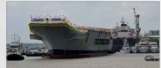
인도 해군의 독자건조 항공모함 Vikrant함