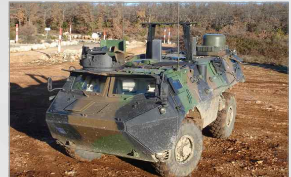
비너스 단말을 설치한 VAB 경장갑차량