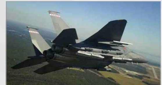
F15-E 전투기에 탑재된 SDB II

• 기존의 SDB I은 보잉사에서 비상작전용을 보충하기 위해 2016년 6월까지 1960발을 납품할 예정임.