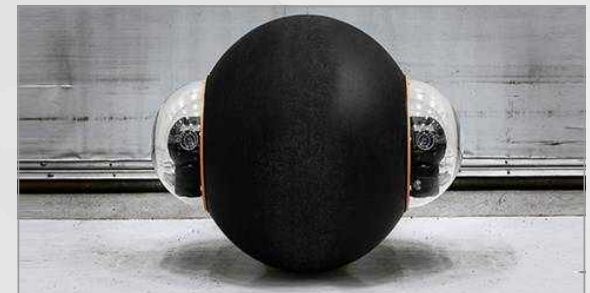
가드봇 상륙체계 모델 중 하나