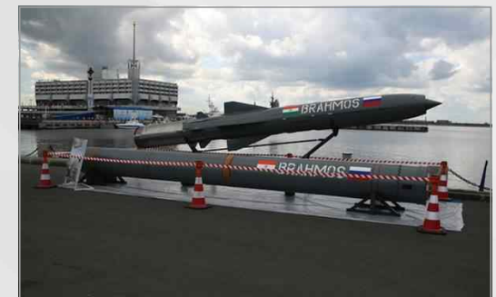
인도 브라모스 순항미사일