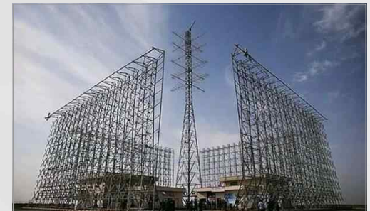
세페르(Sephr)장거리 레이더 체계