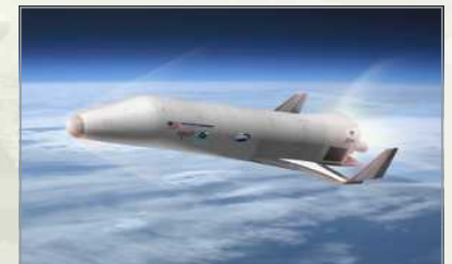
▶ XS-1 우주선