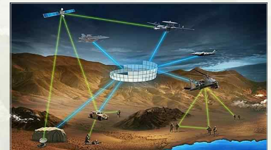
▶ STT를 활용한 전술네트워크 개념도