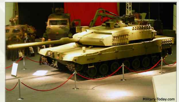
▶ 주력전차 Altay 모형