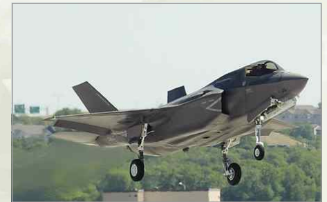
▶ F-35 Lightning II JSF