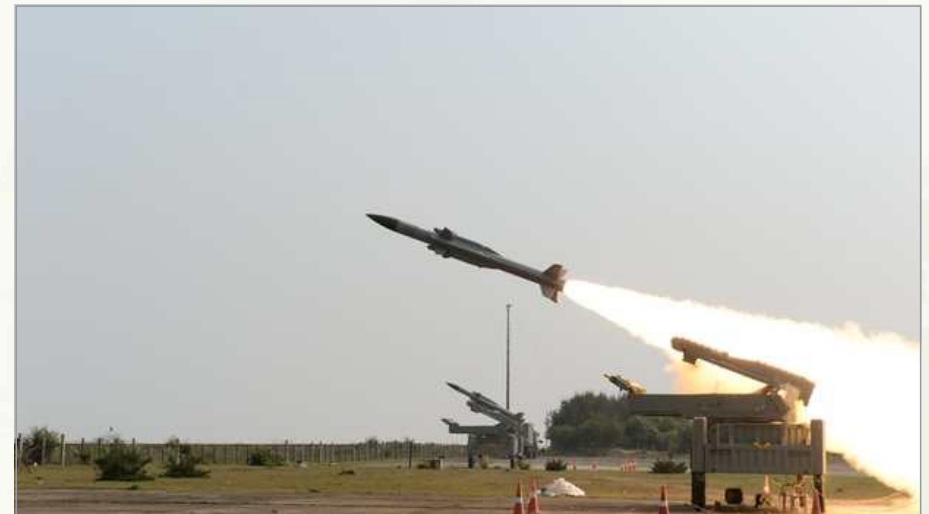
▶ Akash 미사일 발사 (Odisha 해안 통합시험사격장)