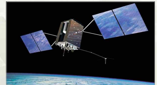
▶ 인공위성 모습