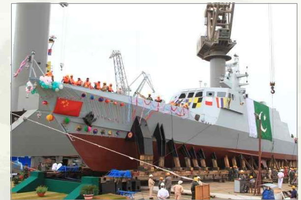
▶ 파키스탄 해군의 고속공격정 ‘Dehshat’함