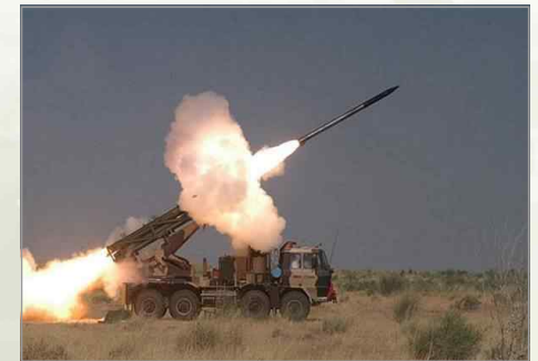
▶ 시험 발사를 하고 있는 인도의 다연장 로켓 체계