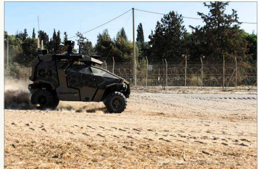
▶이스라엘 Gaza 국경지대를 순찰 중인 Guardium UGV