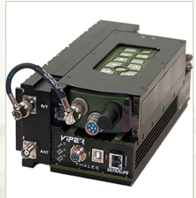
▶ VIPER 무전기