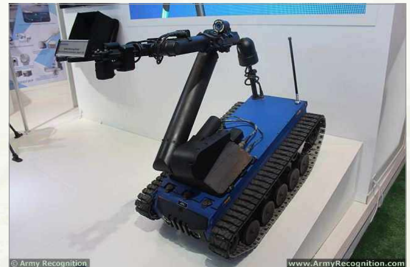
▶ KADEX 2014에서 공개된 Aselsan사 폭발물 처리(EOD) 로봇 KAPLAN