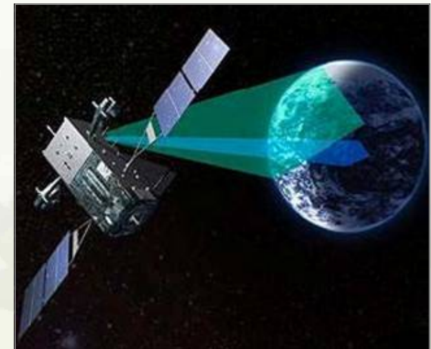
▶ 정지궤도 SBIRS