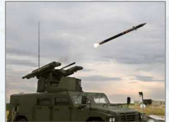
미스트랄 지대공 미사일 탑재 다목적전투차량 MPCV