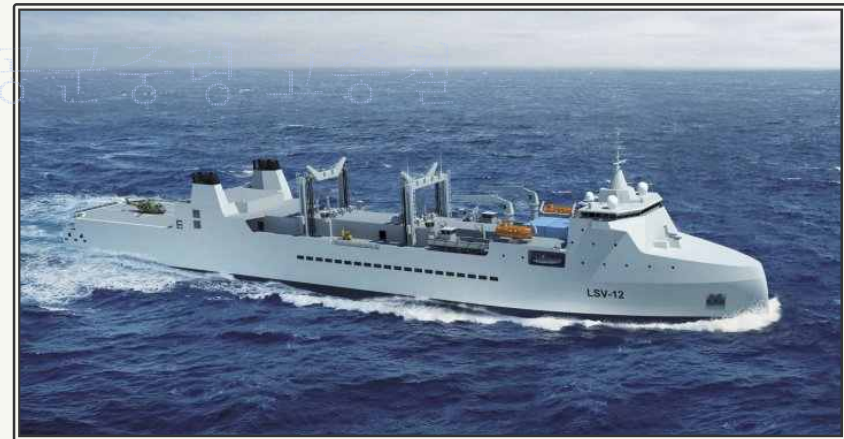
다목적 군수지원함 개념도

| 출처 | DCNS, STX France unveil LSV concept as FLOTLOG solution, 2012, 10, 12. Jane's Navy International [ 목차로 이동 ]