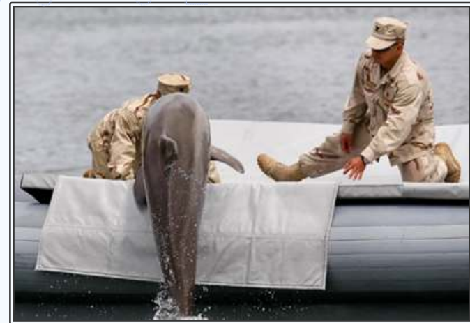
돌고래 군사훈련 장면