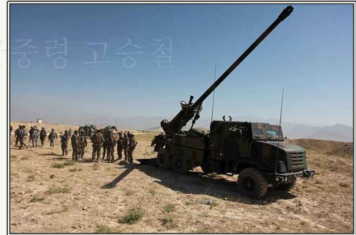
155mm 자주곡사포 CAESAR