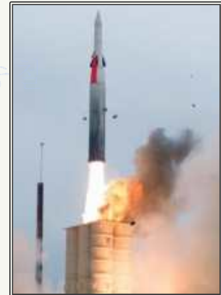
Arrow 미사일 발사 장면