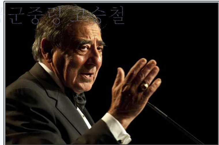
연설 중인 리온 파네타 미 국방장관