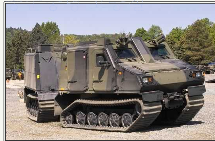
전지형차량 BvS 10 Viking