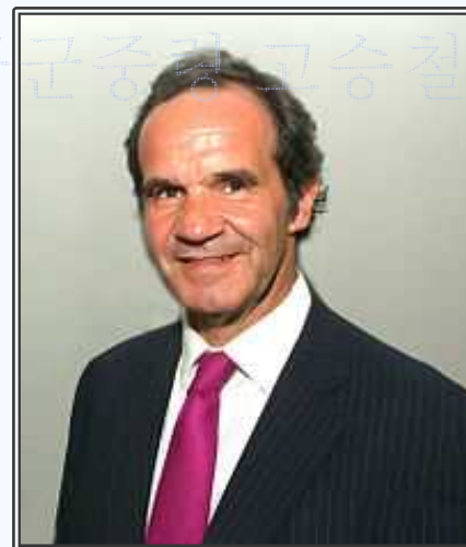
Andrés Allamand 칠레 국방장관