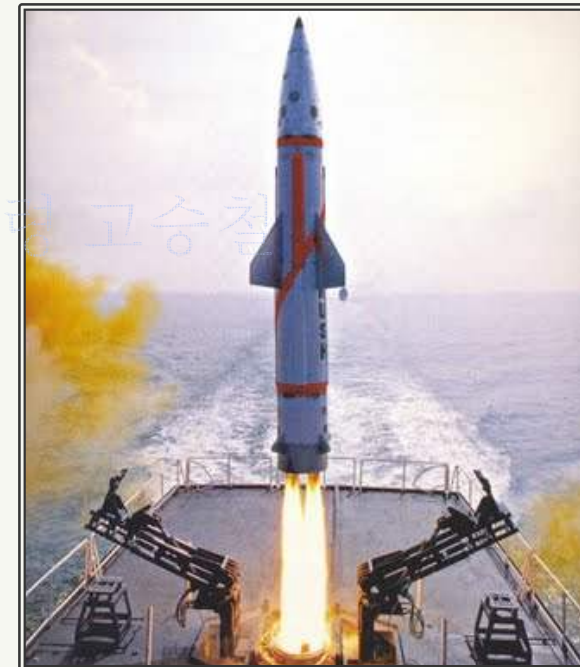
Dhanush 미사일 발사 장면