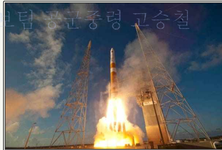
GPS IIF 위성 발사