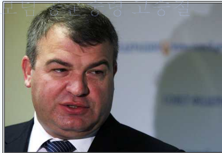
Anatoly Serdyukov 러시아 국방부 장관

| 출처 | Russian military pay raises, but draft to remain -chief, 2012.10.7. en.rian.ru