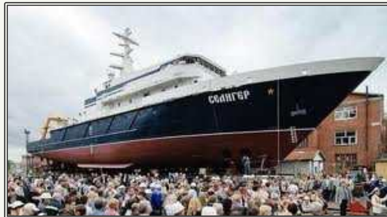
Seliger함 진수식 장면