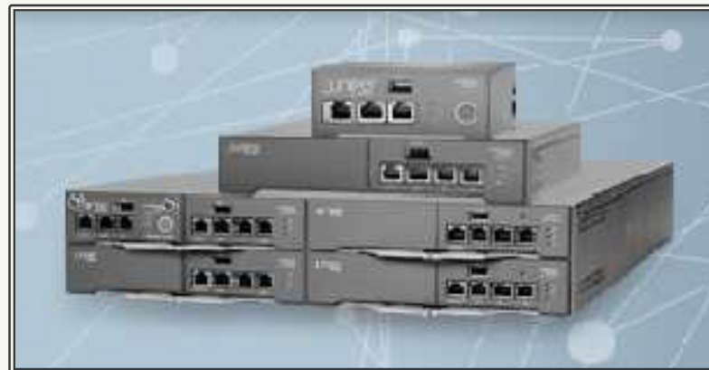
Juniper사 MAG 펄스 게이트웨이 계열

| 출처 | Strategic USAF communications upgrade enters final phase, 2012.6.19, jdet.janes.com