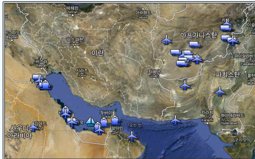
이란 주변국에 배치된 미군 기지 현황