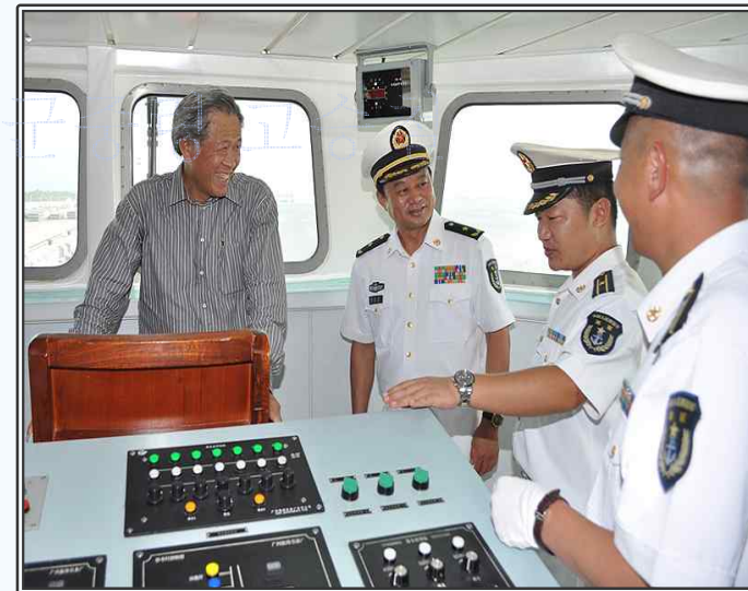
중국 함대에 승선한 응 옹 헨 국방장관

| 출처 | 新加坡防长访问南海舰队 参观陆战旅护卫舰, 2012.6.20, xinhuanet.com