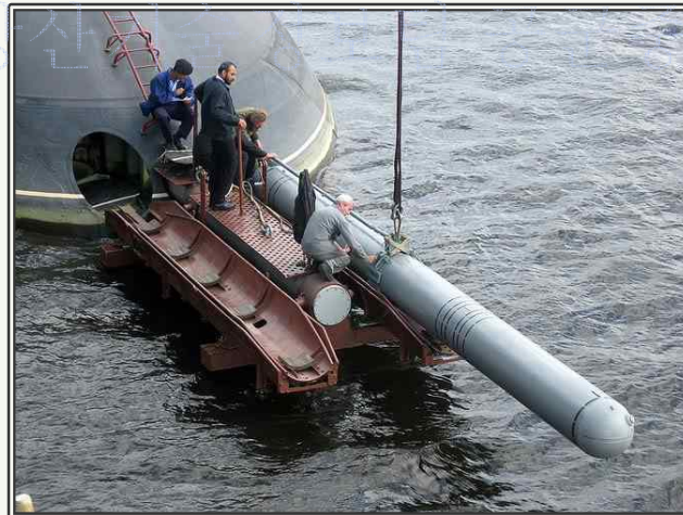
Klub S 대함 미사일 장착 장면