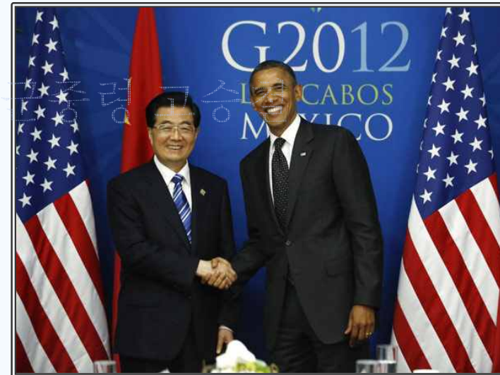
후진타오 중국 주석과 버락 오바마 미국 대통령