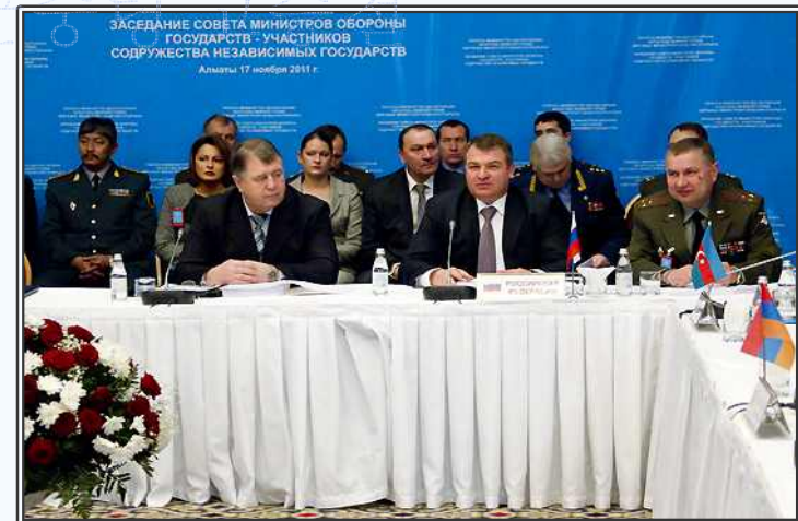
2011년도 독립국가연합 국방장관 회의 장면

[ 목차로 이동 ]