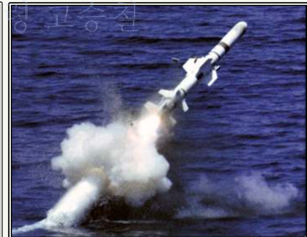
Harpoon 미사일 발사 장면