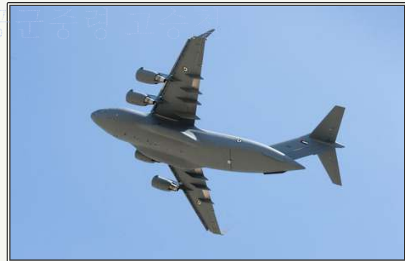
C-17 Globemaster III