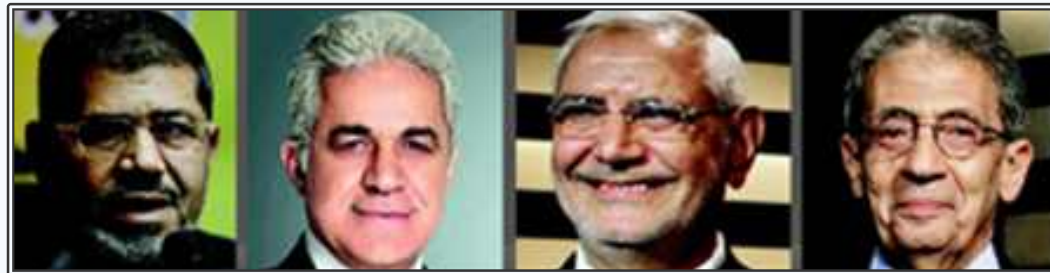
(좌측부터)무함마드 무르시, 사하비, 아불포투, 아무르 무사