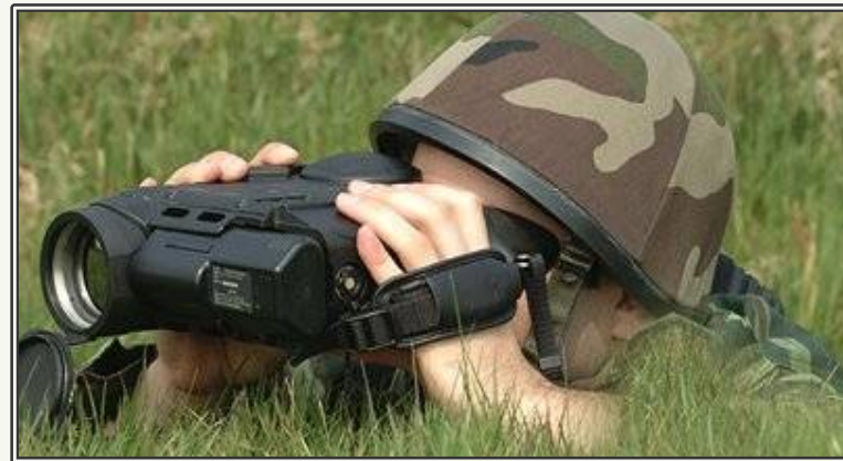
Sophie 열상 카메라