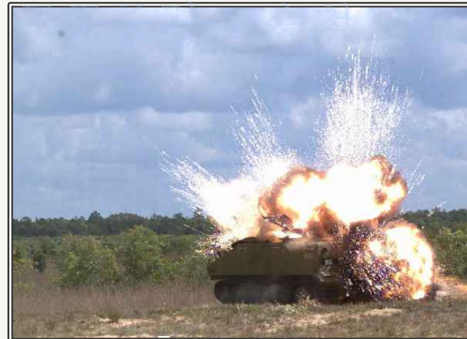
APKWS 목표물 타격 장면