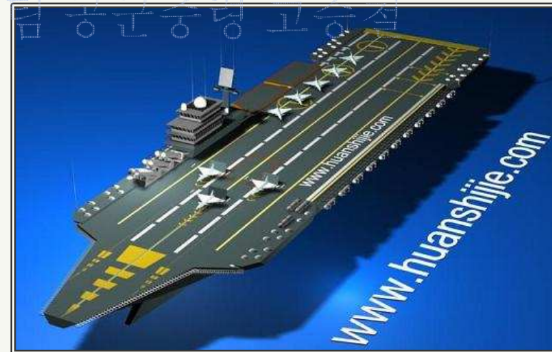
중국의 미래형 항모 개념도