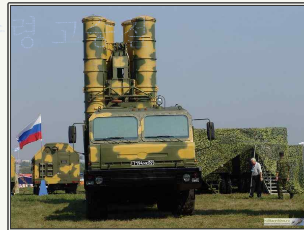
S-400 Triumf 미사일