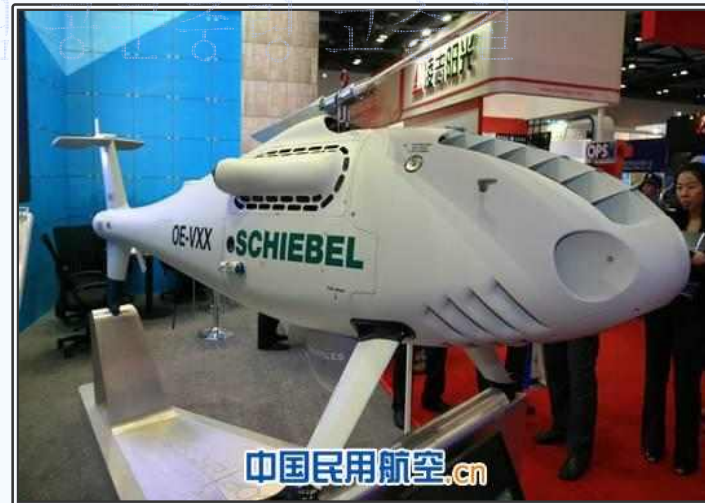
전시 중인 SCHIEBEL사의 무인헬기 모형

- 폭동진압용 장갑차량, 경(輕)전투차량, 폭동진압체계, 무인헬기, 2010식 18.4mm 자동 방폭(防暴)총 등 첨단 경찰장비들이 전시됨