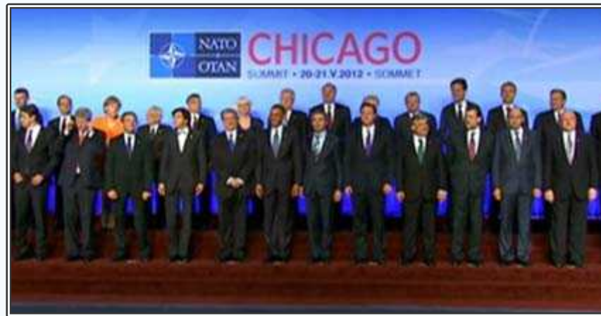
시카고 회담에 참석한 NATO 정상들