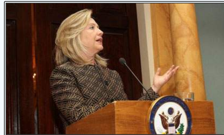
힐러리 클린턴 미 국무장관

| 출처 | Clinton arrives in China amid uncertainty over dissident, 2012.5.1, reuters.com