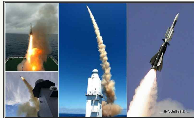
Sea Viper 미사일 발사 장면