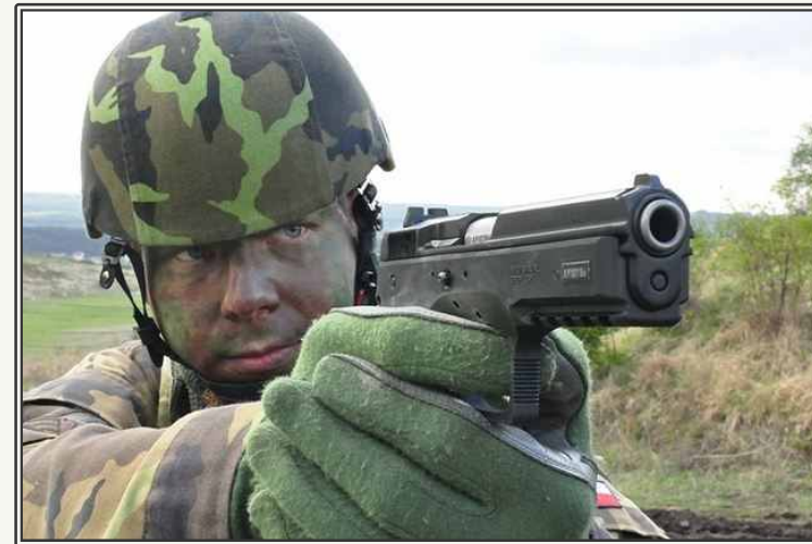
신형 CZ 75 SP-01 PHANTOM 권총