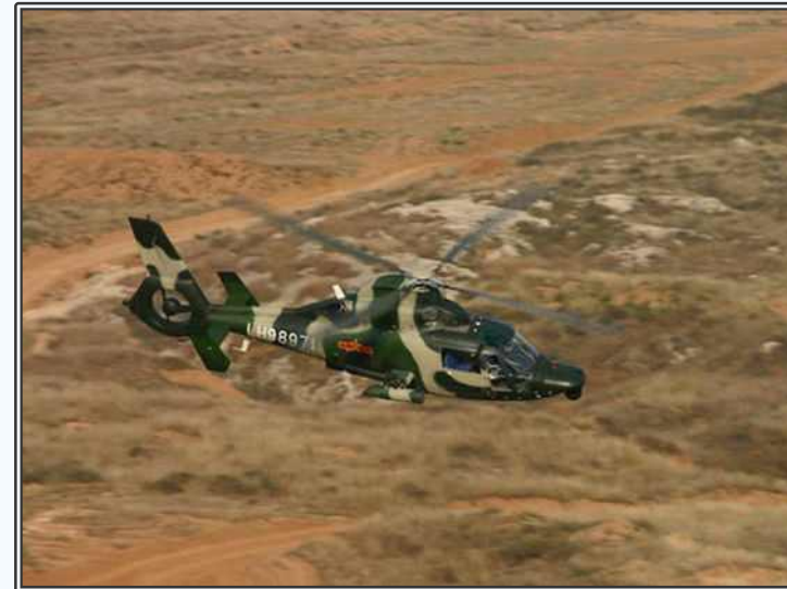
중국 Z-9 헬기