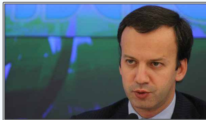
Arkady Dvorkovich 대통령 보좌관