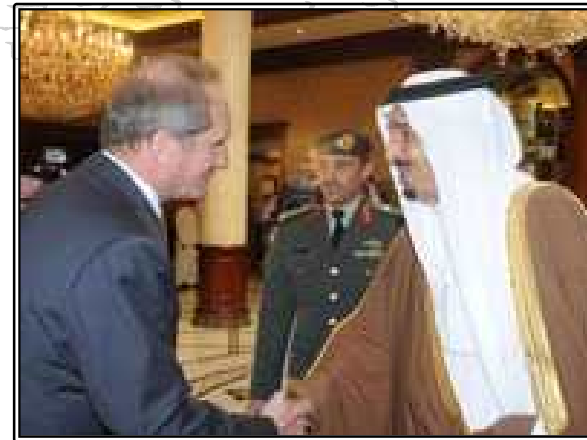
그림. 프랑스 국방장관과 사우디 국방장관