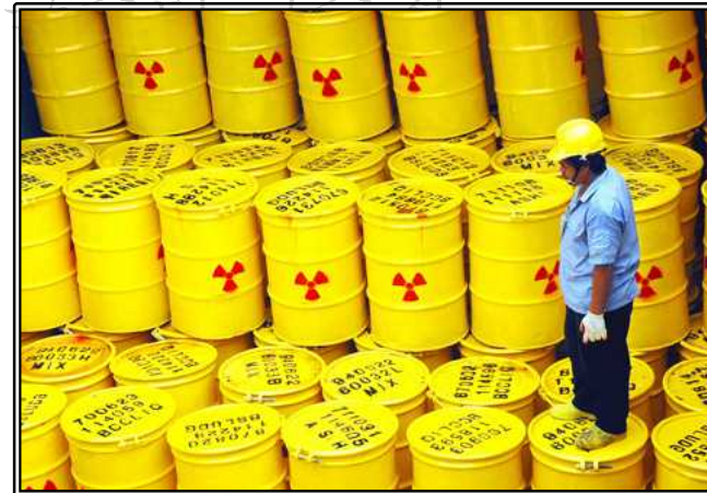
그림. 핵 폐기물