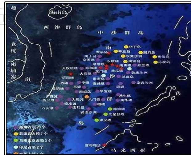
그림. 중국의 남중국해 도서 지도