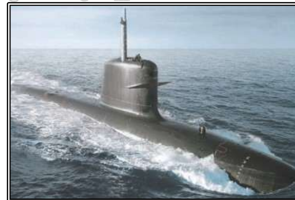
그림. Scorpene 잠수함