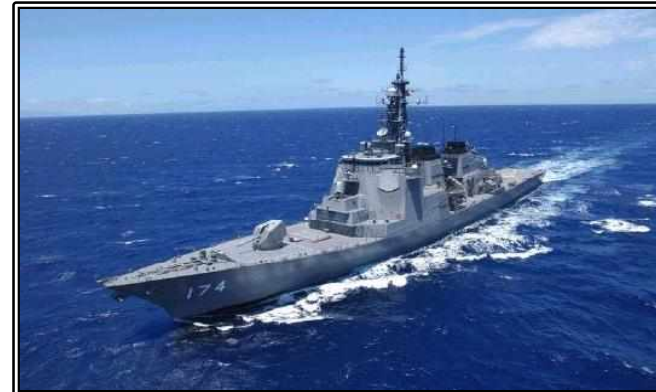
그림. 일본 이지스함 키리시마