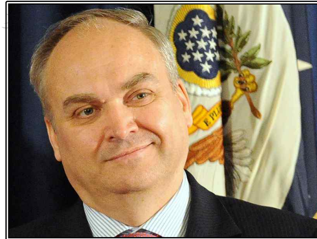
그림. Anatoly Antonov 러시아 국방차관