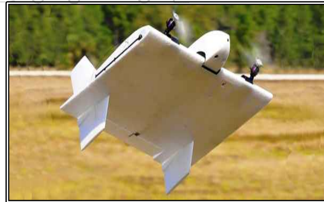
그림. Skate UAV