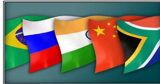
그림. BRICS 국가 (Brazil, Russia, India, China, South africa)