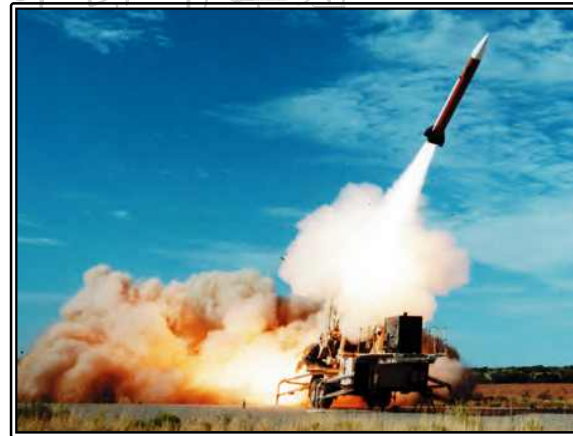
그림. 패트리엇(GEM-T) 발사장면