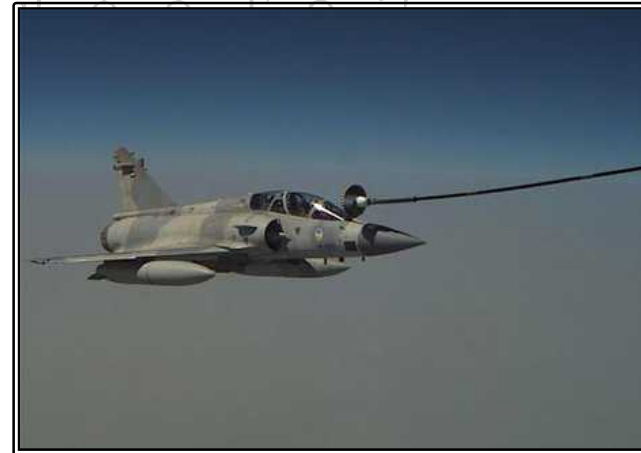
그림. A330에서 공중급유 받는 UAE Mirage 2000기