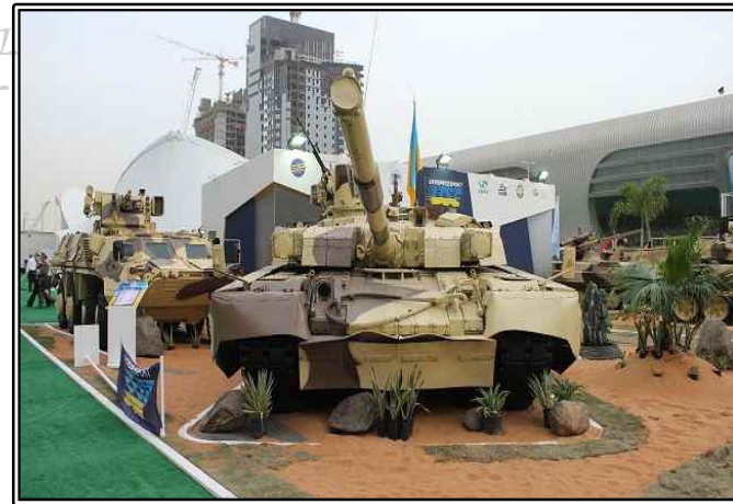
그림. T-84u Oplot MBT