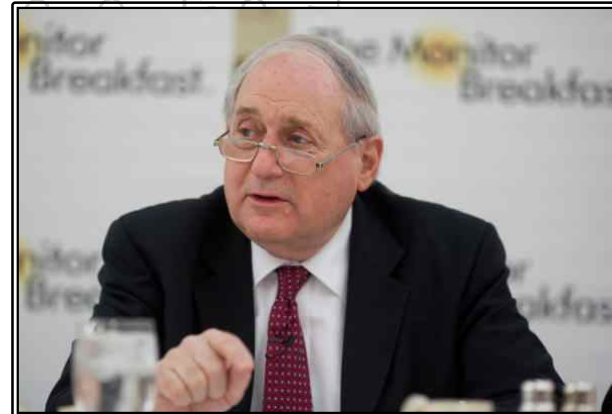
그림. 미 상원군사위원회 Carl Levin 의장