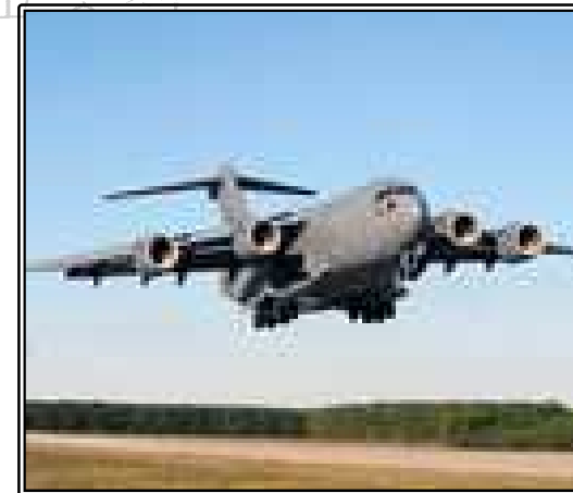
그림. C-17 전략수송기