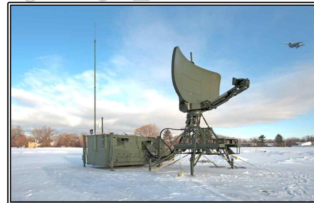
그림. Deployable Radar Approach Control