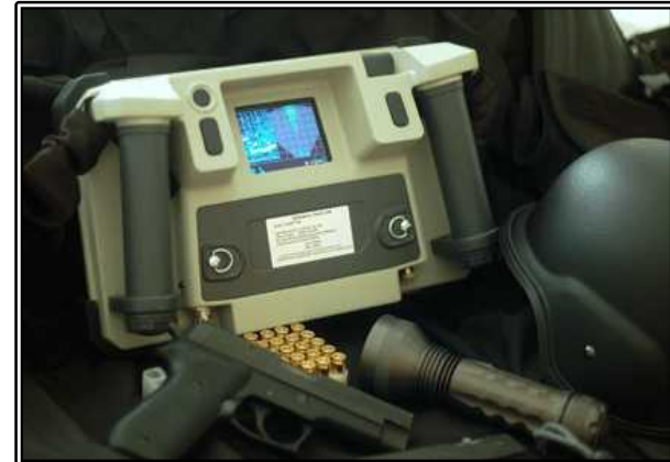
그림. Xaver 400