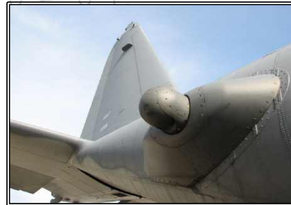
그림. LAIRCM 장착 모습