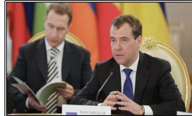
그림. Medvedev 러시아 대통령