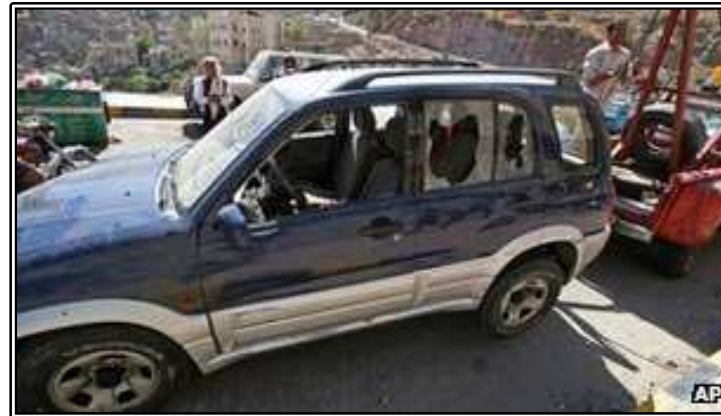
그림. 교사가 타고 있던 차량