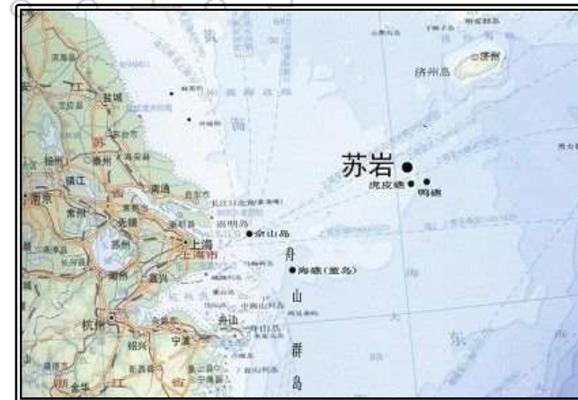
그림. 이어도의 중국식 명칭 수옌도