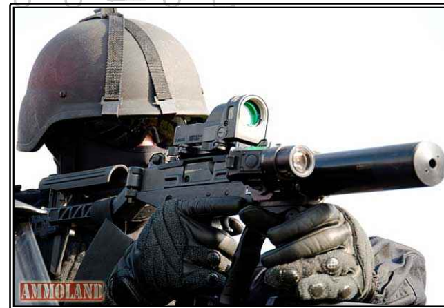
그림. IWI사의 UZI PRO 기관단총