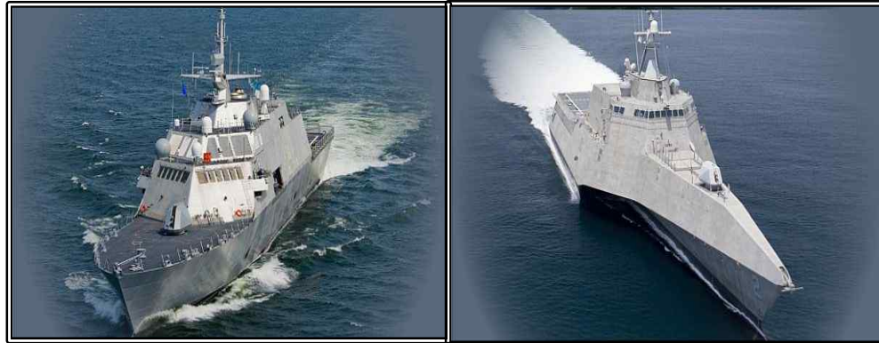
그림. Lockheed Martin사의 LCS 1(좌) 및 Austal USA사의 LCS 2