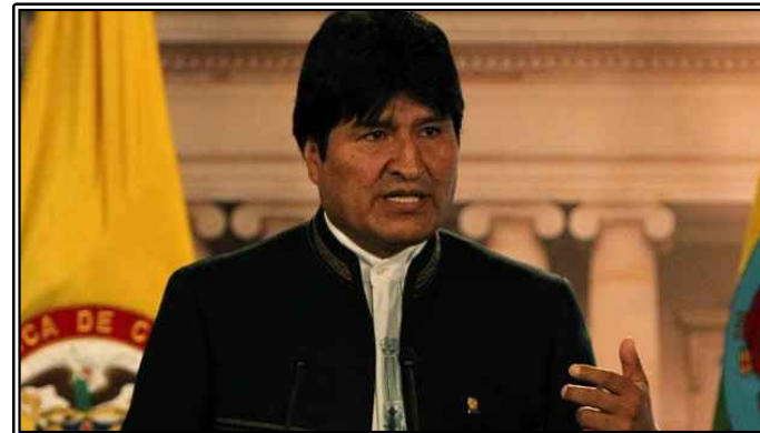
그림. 볼리비아 대통령 Evo Morales