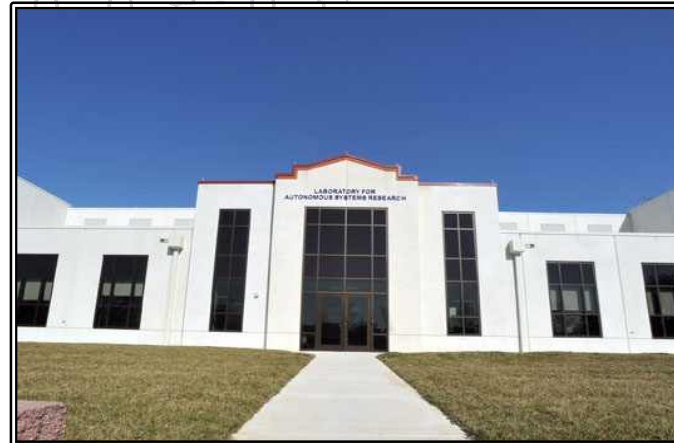
그림. LASR 전경