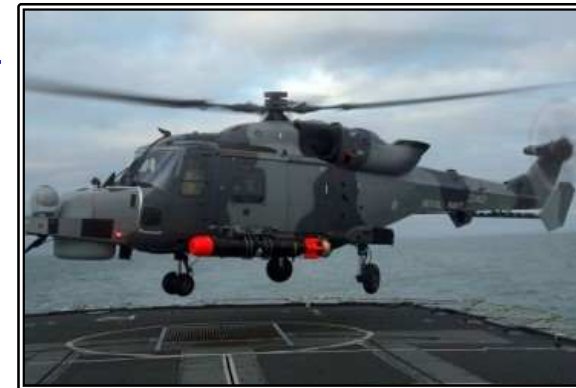
그림. 신형 Lynx 'Wildcat' 헬기