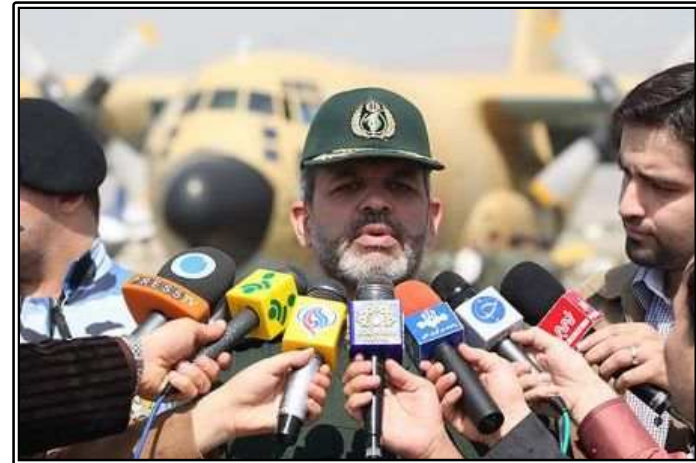
그림. 국방장관 Ahmad Vahidi 준장