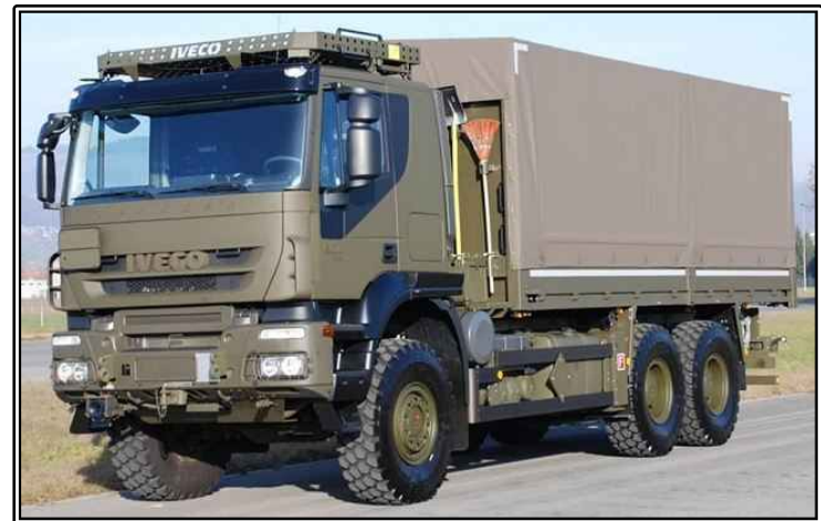
그림 IVECO 6x6