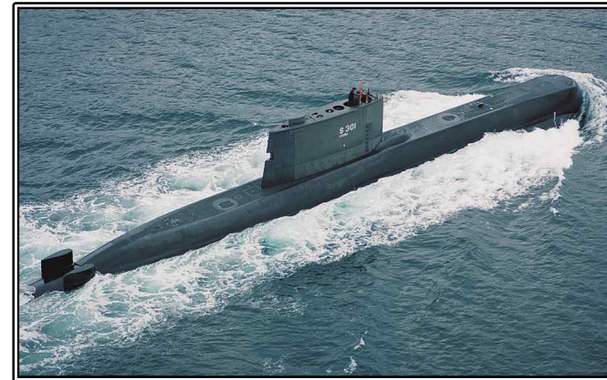
그림. 노르웨이 해군의 Ula급 잠수함